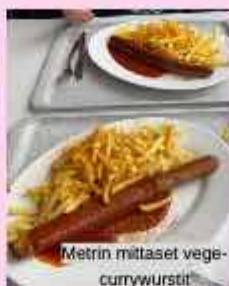
Metrin mittaiset veggywurstit