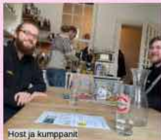
Host ja kumppanit

Juna Hampurista Hannoveriin olikin peruttu ja lähti eri asemalta kuin alunperin ostettu lippu... Onneksi saatiin ostettua lippu junaan, jolla päästiin Hannoveriin! Perillä odotti iloinen vastaanotto ja kahvitarjoilu <3