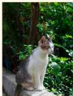
PELIMESTARI Sami Väisänen