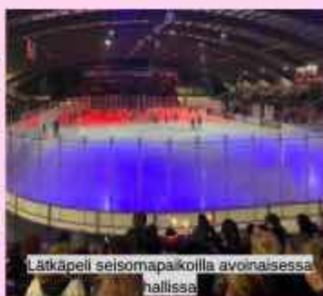
Lätkäpeli seisomapaikoilla avoimaisessa hallissa