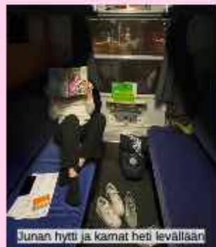
Junan hytti ja karnat heti levällään

Tukholmasta lähetettiin yöjunalla Köpiksen kautta kohti Hampuria. Matkan töhöily ei loppunut... Luultiin, että meillä olis ollut normi istumapaikat ja sekoiltiin siinä mihin mennään :D Konduktööri naureskeli mejän sekoiluille ja melkein olemattomille ruotsin taidoille.