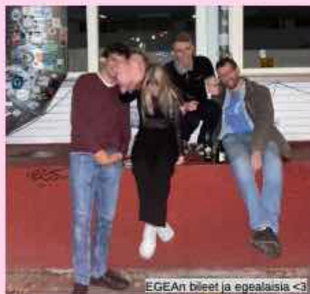
EGEA:n bileet ja egealaisia <3

Hannoverissa päästiin kiertelemään kaupunkia ja kampusta sekä tutustumaan paikalliseen EGEAan ja opiskelijakulttuuriin! Oltiin esim. lätkäpelissä ja "vaeltamassa". Päästiin lisäksi maistelemaan saksalaisia ruokia ja tutustuttiin superkivoihin tyypeihin!!