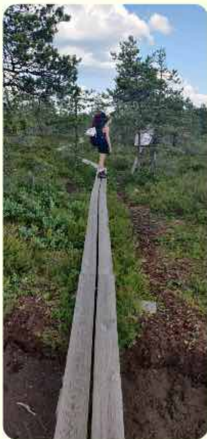
Savojärven kierroksen pitkospuilla.

Sattmarkin luontopolut löytyvät Paraisilta, Sattmarkin sillan kupeesta. Paikka toimii hyvin päiväretkikohteena, mutta myös etappina Saariston rengastiellä retkeilevälle. Maisema tällä pisimmillään 11 km mittaisella polulla, on vaihtelevaa, sillä se kulkee vuoroin kallioilla, metsässä ja pellolla, ja taitaa vastaan tulla jonkinlaista kosteikkoakin. Monipuolisuuden myötä polut tarjoavat myös esimerkiksi kasveista ja hyönteisistä kiinnostuneelle syitä pyllistellä polun varressa. Sattmarkista löytää kesäkaudella lisäksi kahvion ja bistron sekä uimarannan.