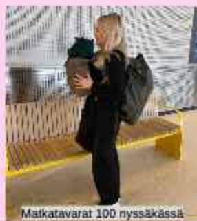
Matkatavarat 100 nysäkässä

Matka alkoi junalla Turusta Helsinkiin, josta otettiin laiva Tukholmaan. Reissun alku oli täynnä pikkuyllätyksiä kun luultiin, että laiva lähtee Turusta (kannattaa aina tarkistaa lähtösatama xd) ja puolet seurueesta olikin kipeänä :D