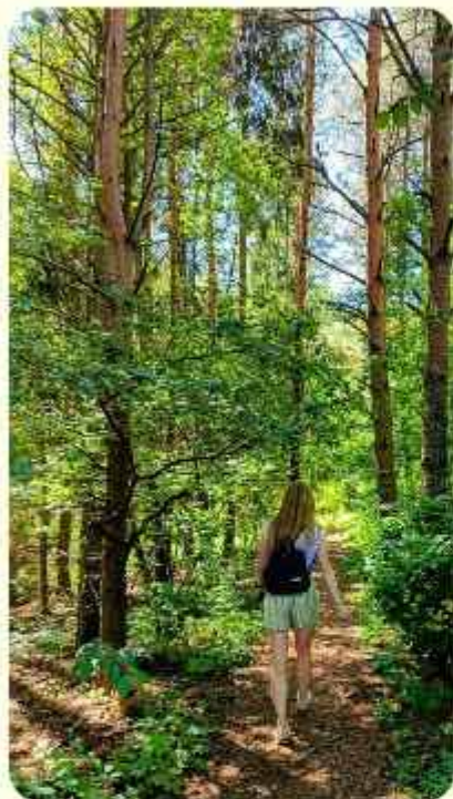
Jaaninlaakson metsää Jaaninojan varrella.

Kuusiston saari on mainio kohde pyöräretkelle. Kuusiston linnanrauniot ja Kappelinmäen luontopolku ovat yhdistelmä luontoa ja historiaa, ja läheltä löytyy myös kaksi lintutornia – Kuusistonlahden pohjoinen ja eteläinen lintutorni. Matkalla Kuusistoon voi poiketa pulahtamassa, esimerkiksi Voivalan tai Kuusiston uimarannoilla.