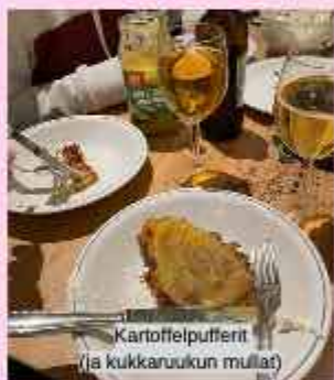
Kartoffelpufferit (ja kukkaruukun mullat)