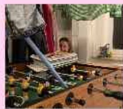
Pöytäfutis kotibileiden vessa